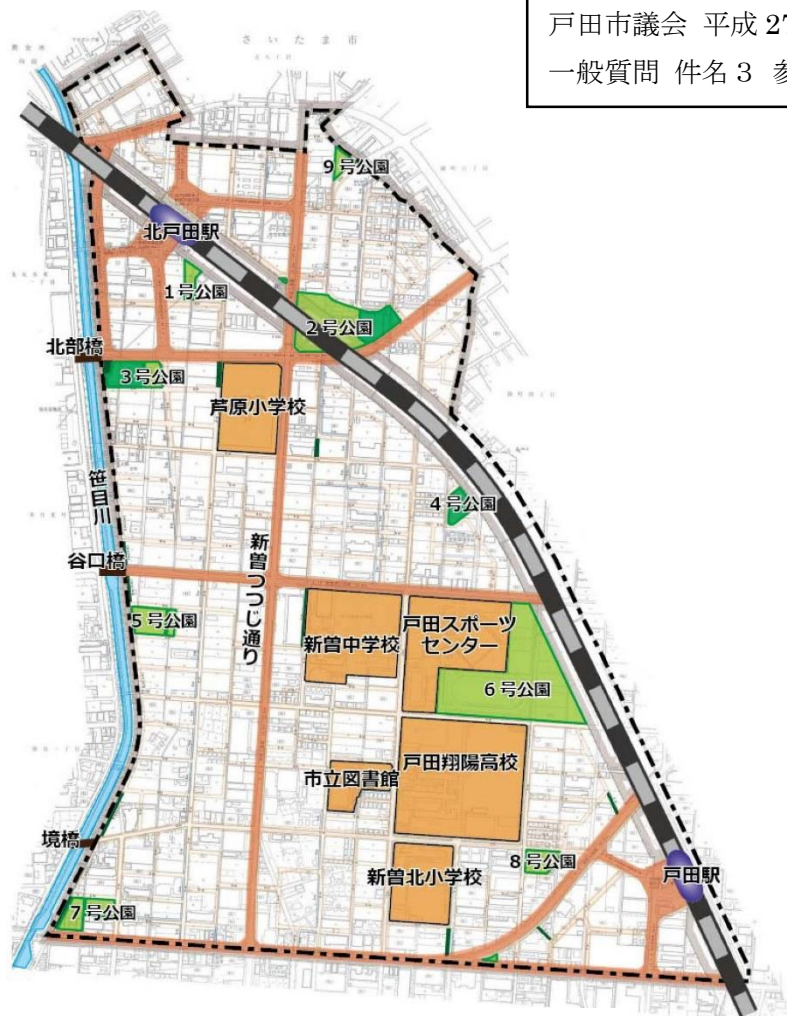
▲新曽第一土地区画整理事業の概要